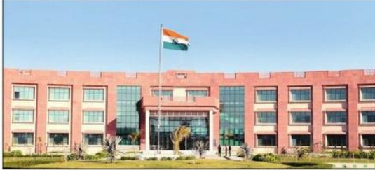
हरियाणा केंद्रीय विश्वविद्यालय महेंद्रगढ़।